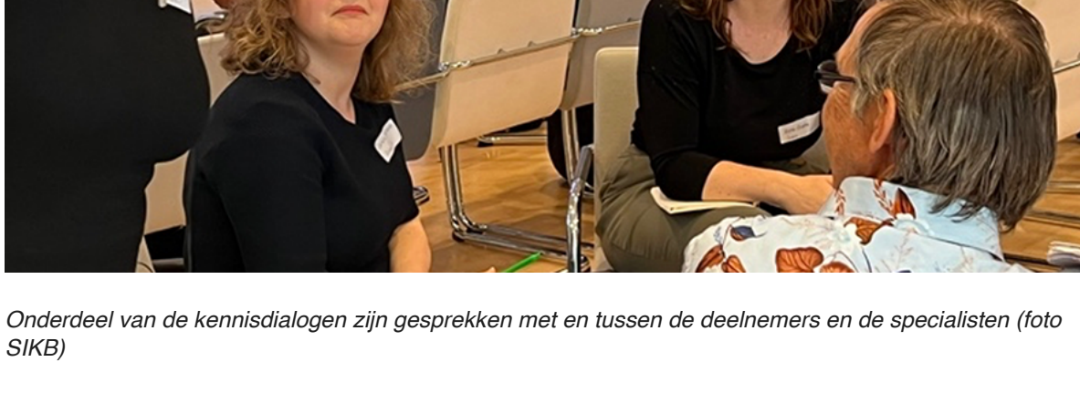
Onderdeel van de kennisdialoog zijn gesprekken met en tussen de deelnemers en de specialisten

Op 13 juni j.l. vond bij de RCE de vierde Kennisdialoog plaats met als thema 'Meer weten over eten! Over voedselresten & voeding in de archeologie'. Daarin stonden de methoden en Scanning Elektronen Microscopie (SEM), Infraroodspectroscopie (FTIR), Massaspectrometrie (DTMS), Lipiden- en Proteïneonderzoek in de spotlight. Verschillende specialisten presenteerden kort hun onderzoekstechnieken en de meest actuele ontwikkelingen binnen hun techniek. Ook zoomden we in op het nieuwe kennisplatform www.vindhetverleden.nu . Daarover hieronder meer. Na elke presentatie was er ruimte voor een dialoog tussen de deelnemers en de specialisten.