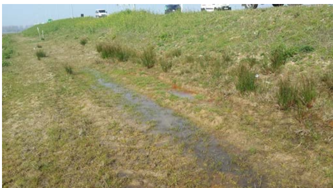
Foto: verzadiging teen talud.

Het opleidingssysteem borgt dat inspecteurs (intern of extern) worden bijgeschoold als AS SIKB 6900 inhoudelijk wordt gewijzigd.