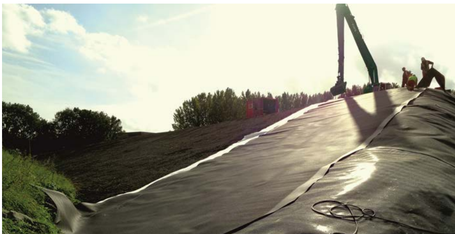
Foto: overzicht aanleggen IBC werk.

De accreditatie(s) wordt (worden) bovendien gebaseerd op de protocollen die horen bij AS SIKB 6900. In de Regeling bodemkwaliteit (Rbk) zijn voorwaarden/eisen opgenomen over de frequentie van periodieke inspecties in de beheerfase. Deze versie 2.0 van de AS SIKB 6900 alsmede de bijbehorende protocollen (allen versie 2.0) zijn vastgesteld door het AC Bodembescherming op 15 februari 2018. Zij treden op 30 november 2018 in werking en vervangen alle eerdere versies. De eerdere versies van AS SIKB 6900 en de protocollen worden ingetrokken per 1 april 2020. Organisaties met een accreditatie conform AS SIKB 6900 versie 1.0 kunnen tot 1 april 2020 hun accreditatie om laten zetten conform AS SIKB 6900 versie 2.0 verkregen na een positief verlopen accreditatie-onderzoek. Dit onderzoek valt binnen de jaarlijkse steekproef. Afgegeven accreditaties conform AS SIKB 6900 versie 1.0 die niet voor 1 april 2020 worden omgezet, worden ingetrokken. Het is niet mogelijk om accreditatie te verkrijgen voor dit schema, versie 2.0 in combinatie met protocollen met een lager versienummer dan 2.0.