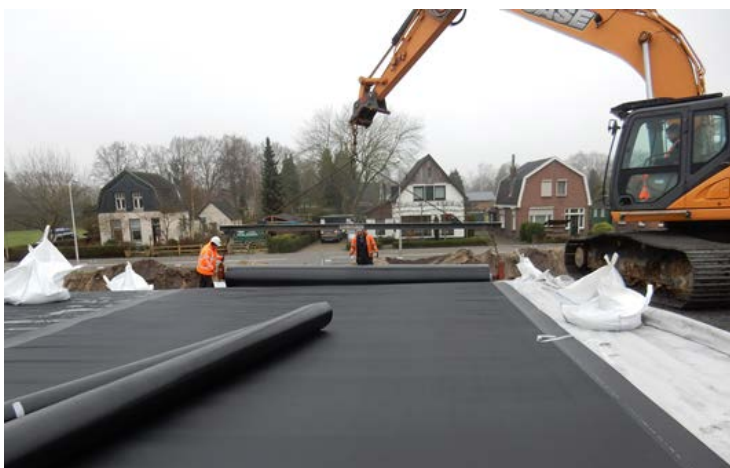
Foto: aanbrengen HDPE-Folie