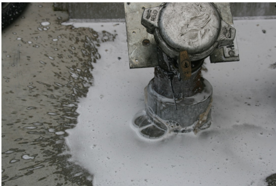
Foto: Luchtlekkage bij doorvoer.

Doorvoeren De DI beoordeelt bij doorvoeren in de voorziening, of vloeistoffen langs of door de doorvoeren – eventueel voorzien van een afdichting met voegvullingsmassa of een pakking – de niet-belaste zijde of bodem hebben bereikt en niet kunnen bereiken.