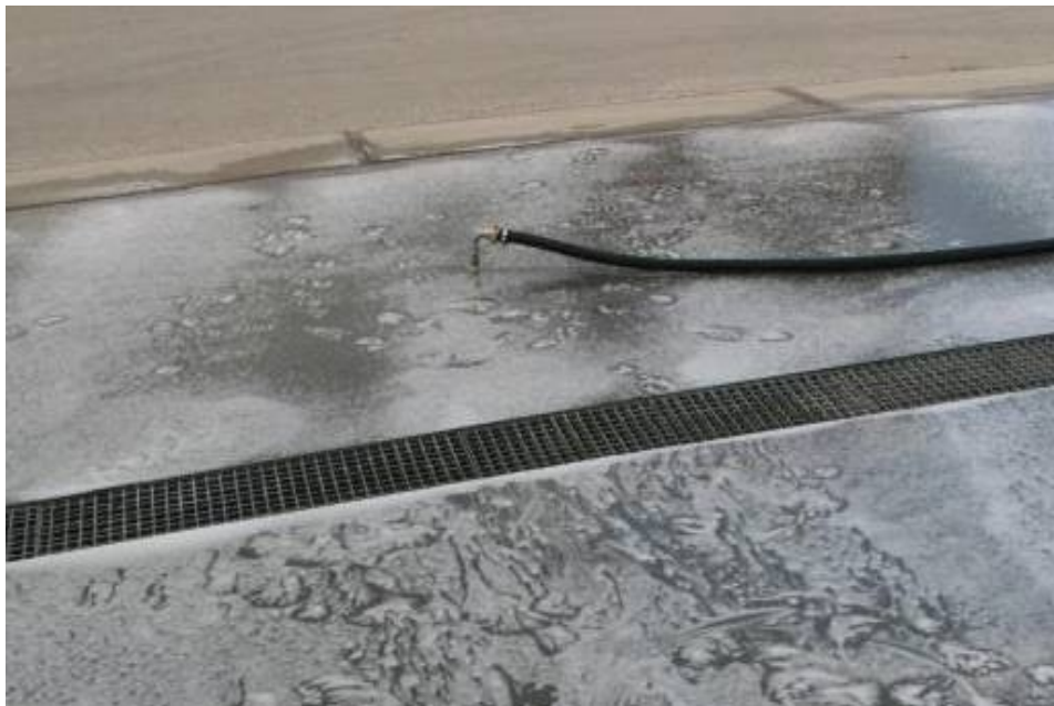
Foto: Voorbeeld van luchtinbrengpunt.

De hoeveelheid en overdruk van lucht moeten ook op de apparatuur waarmee de lucht wordt getransporteerd worden aangetoond en geregistreerd.