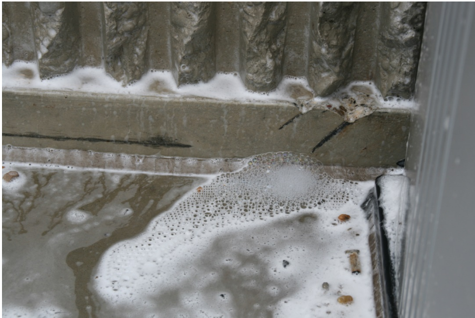
Foto: Luchtlekkage bij aansluiting.